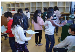
投票は会議室で ドキドキしながら投票している様子