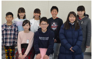
左4人新役員 右4人旧役員