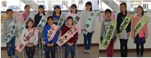
左前列5年会長候補 後列副会長候補 右3人4年副会長候補

3学期に入り、来年度の児童会の役員を決める時期になりました。昨年の12月ごろから選挙管理委員を組織し、いろいろな準備をしました。特に、5年生と4年生の各学級では、どんな学校にしていきたいか、そのためには誰を候補者として立てるのかを何度も話し合ってきました。1月17日からは